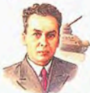
Советский конструктор танков М. М. КОШКИН • 1898–1940